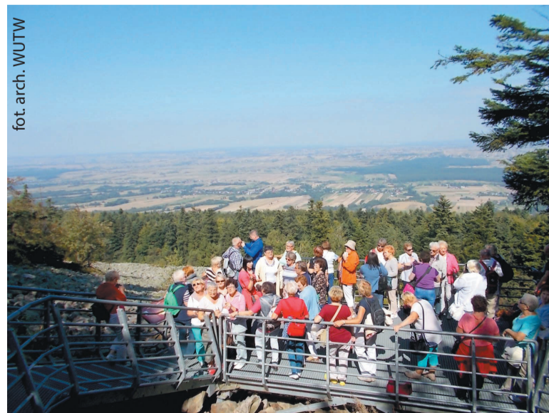
Widok na Świętokrzyski Park Narodowy i gołoborza