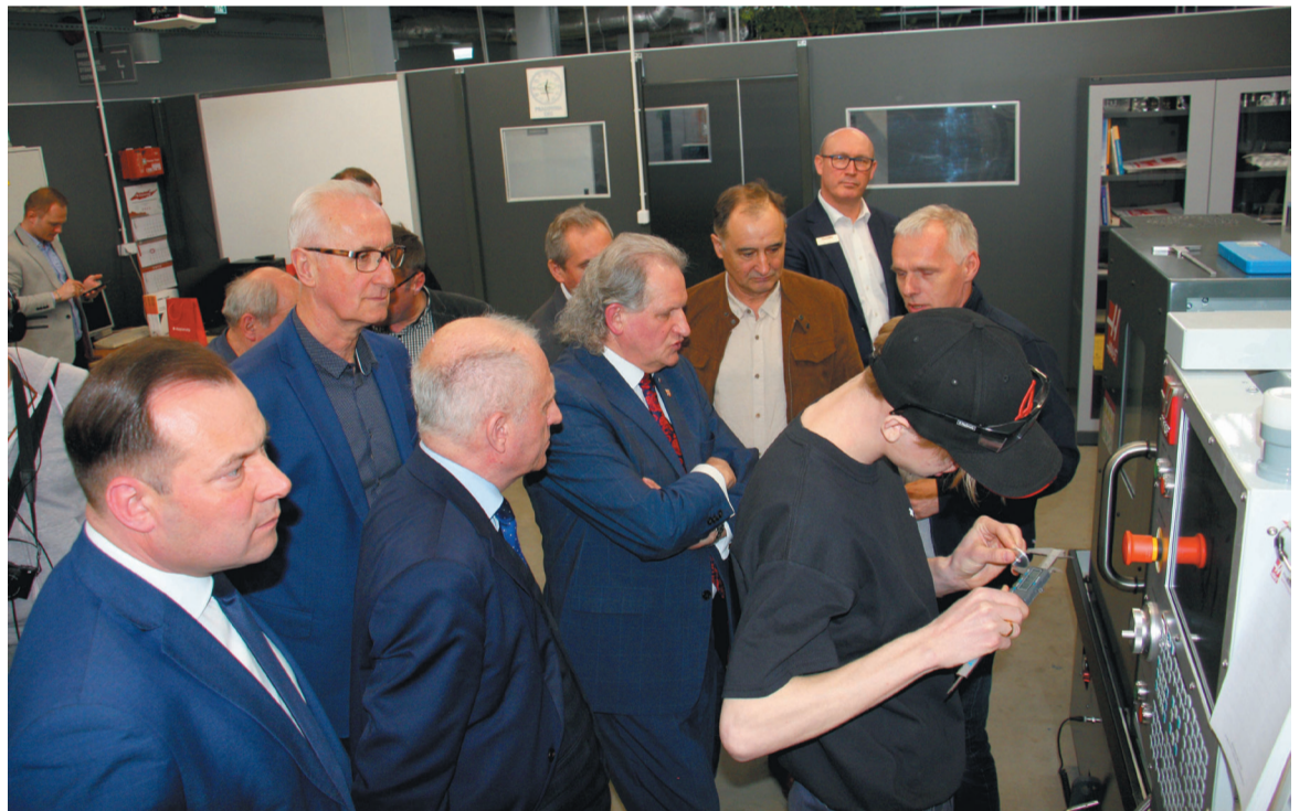
Prezentacja możliwości jednej z obrabiarek firmy Haas