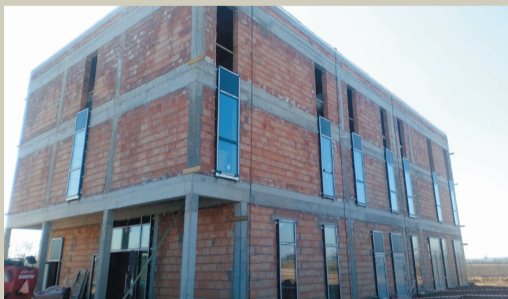
Montaż stolarki zewnętrznej