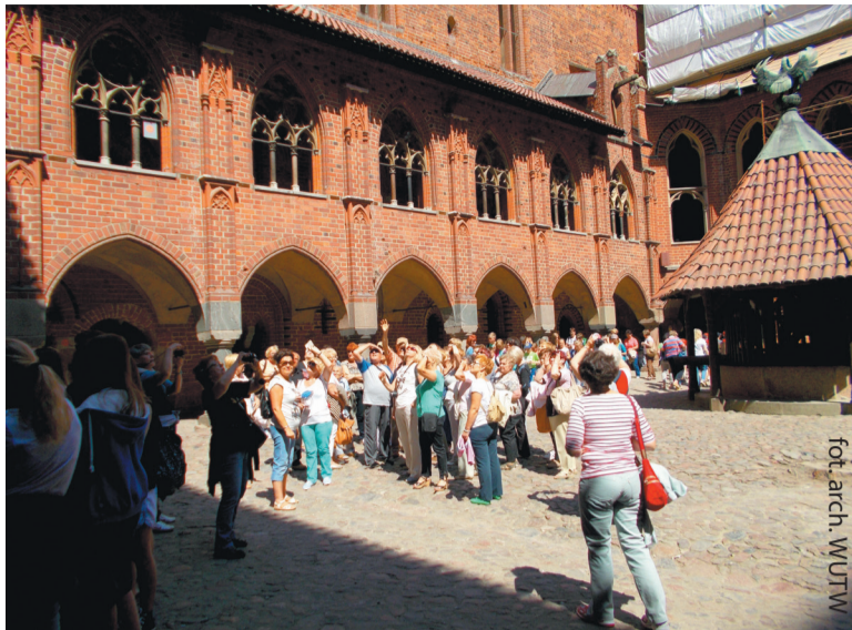
Na zamku krzyżackim w Malborku

chodnią część Polski. Wybrzeże Bałtyckie zwiedziliśmy od Helu po Świnoujście. W Trójmieście byliśmy w czasie obchodów Jarmarku Dominikańskiego, co wzbogaciło stałe atrakcje, jakie oferuje Gdańsk z fontanną Neptuna i Dworem Artusa na Długim Targu oraz katedrą w Oliwie ze słynnymi organami. Oprócz najważniejszych zabytków zwiedzaliśmy też miejsca i obiekty związane z najbliższą nam historią: Westerplatte, pomnik Poległych Stoczniovców, Europejskie Centrum Solidarności oraz wybudowany na mistrzostwa Europy w piłce nożnej w 2012 roku stadion Energa Gdańsk. W Sopocie spacerowaliśmy po najdłuższym moście nad Bałtykiem i słynnym deptaku Monciaku, oglądaliśmy Operę Leśną. W Gdyni zwiedziliśmy nie tylko Skwer Kościuszki z Oceanarium i okrętami muzeami Darem Pomorza i Błyskawicą, byliśmy w najnowszym Muzeum Emigracji w historycznym budynku Dworca Morskiego. Z portu popłynęliśmy statkiem na Hel, by zwiedzić fokarium i latarnię morską.