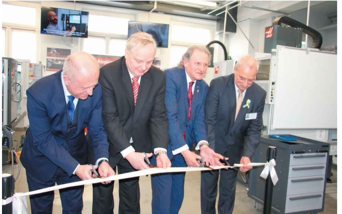
Moment przecięcia wstęgi