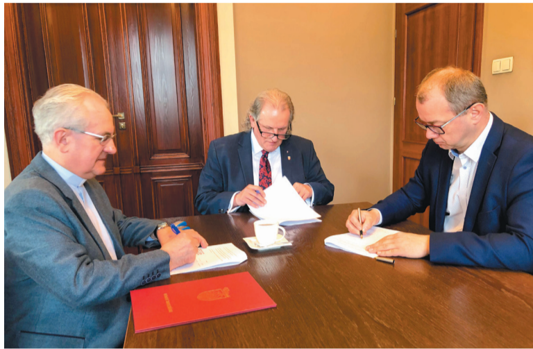
Umowę podpisano w Starostwie Powiatowym we Wrześni

Parafia pw. św. Andrzeja Apostoła w Nekli co roku kontynuuje prace remontowe przy zabytkowym kościele. W roku 2022 w nekelskiej świątyni zaplanowano konserwację i restaurację witraży w oknach od strony północnej.