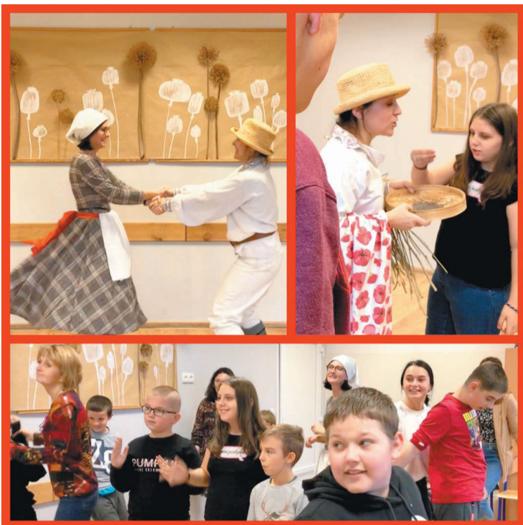
„Etnogadki” to dla wszystkich pouczająca zabawa

Projekt edukacyjny jest ciekawym pomysłem na zajęcia.