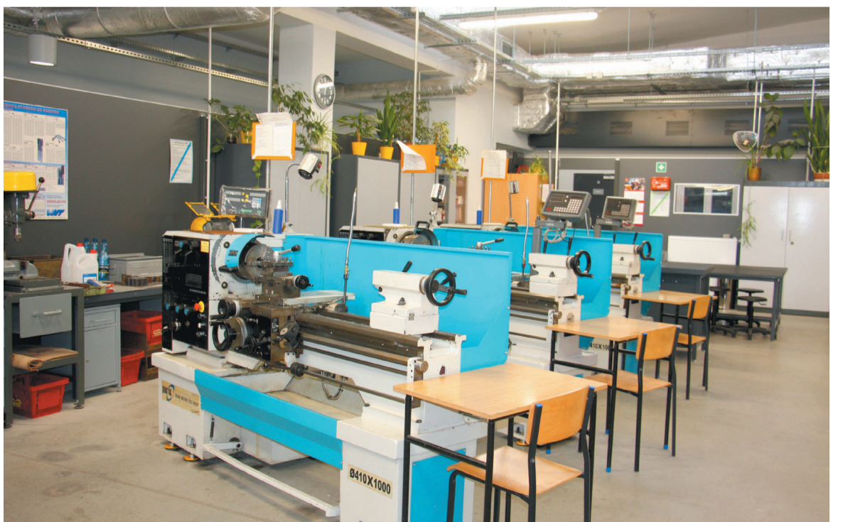
Jedna ze zmodernizowanych pracowni PCEZ