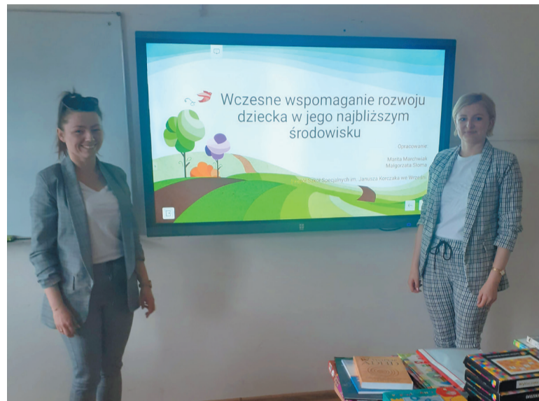
Szkoła przy Leśnej wspiera rodziców swoich uczniów

Na warsztatach przedstawiono umiejętności komunikacyjne dzieci na poszczególnych etapach rozwoju, od urodzenia do ukończenia siódmego roku życia, czyli od okresu melodii, wyrazu, zdania aż do swoistej mowy dziecięcej. Zaproponowane podczas warsztatów zabawy miały na celu rozwijanie u dzieci funkcji naśladowania, wskazywania palcem, budowania wspólnego pola uwagi czy reakcji na imię. Omówiono formy i metody działań wspierających rozwój funkcji artykulacyjnych