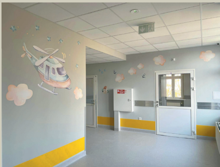
Ozdoby na ścianach