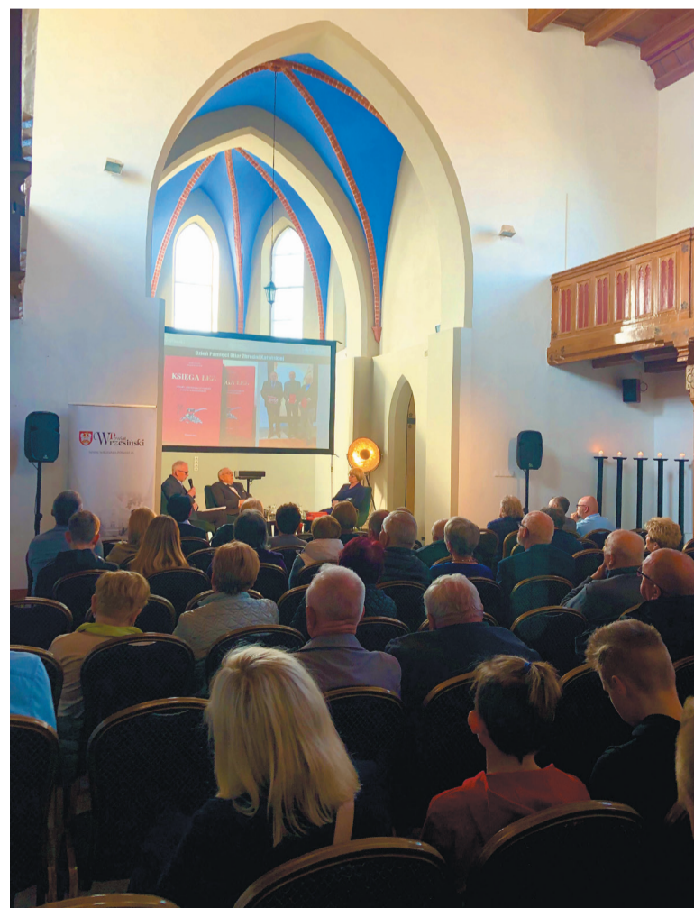
Wydarzenie zorganizowane przez Starostwo Powiatowe we Wrzesni spotkało się z dużym zainteresowaniem