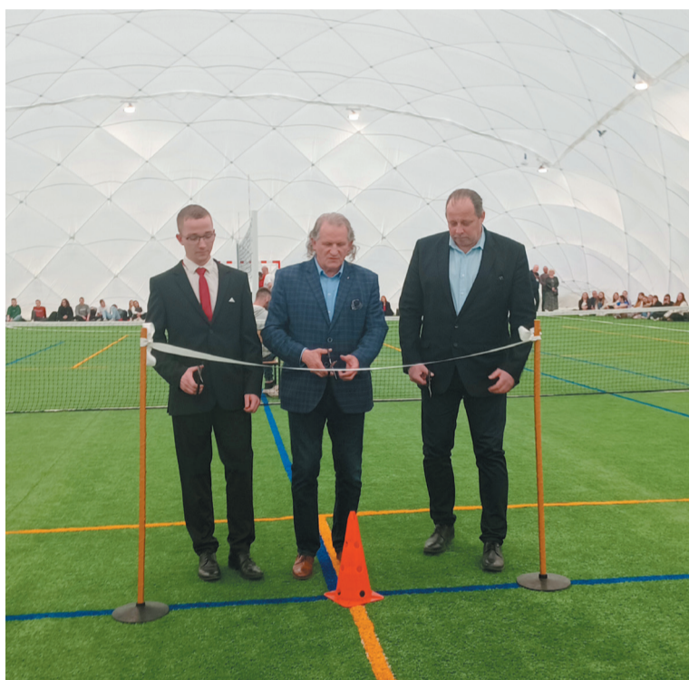
Przecięcie wstęgi oficjalnie otworzyło obiekt