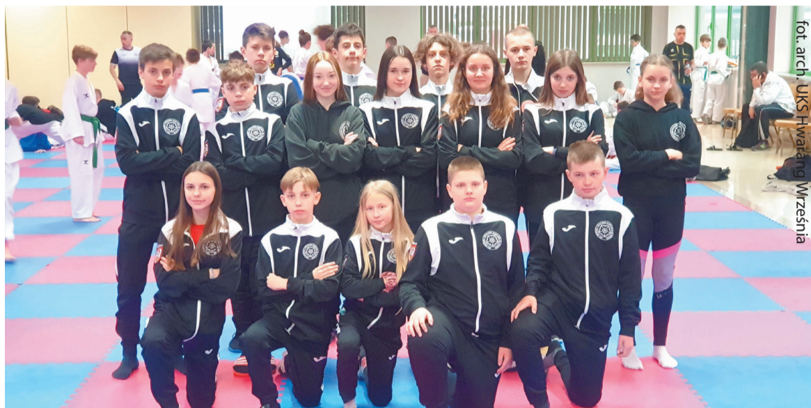
Zawodnicy Hwaranga właściwie z każdej imprezy wracają z medalami

W dniach 8-10 kwietnia 2022 roku w Warszawie odbył się Puchar Polski Kadetów i Juniorów w taekwondo olimpijskim, w którym wystąpili zawodnicy UKS Hwarang Września.