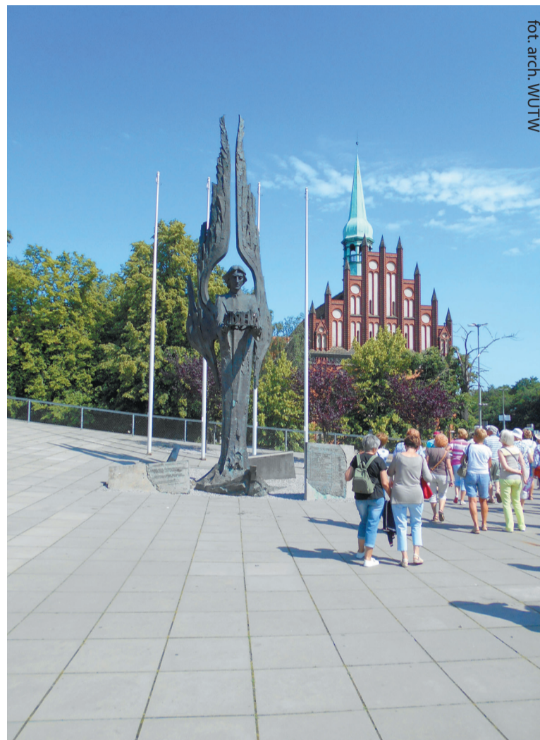
Pod pomnikiem Anioła Wolności w Szczecinie

W województwie mazowieckim zwiedzaliśmy również inne miej-