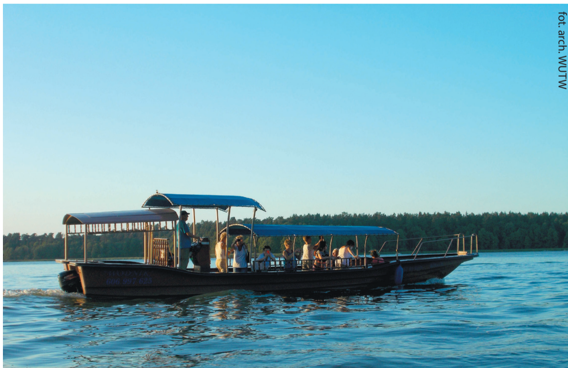
Rejs gondolami po Rospudzie

przystań Żegluga Mazurskiej z cumującymi przy kei jachtami i żagłówkami. Byliśmy we Fromborku zwanym grodem Mikołaja Kopernika, gdzie spędził on ponad 30 lat i napisał swoje najślawniejsze dzieło. Zwiedziliśmy wszystkie obiekty na Wzgórzu Katedralnym: katedrę z XIV w. z grobem wielkiego polskiego astronoma, wieżę dzwonnicy, Muzeum Kopernika w dawnym pałacu biskupim, planetarium, wieżę Kopernika. Na Rynku obejrzelśmy też pomnik wielkiego uczonego. Olsztyn zachwycał nas Starym Miastem z barokowymi kamienicami, XIV-wieczną gotycką katedrą i Starym Ratuszem, ale także Planetarium i Obserwatorium Astronomicznym z cyfrowym systemem projekcyjnym. Ciekawe okazały się niewielkie miasta jak Orneta, Braniewo czy Dobry Miasto. Bardzo ładny jest również Elbląg, którego starówka – zniszczona podczas II wojny światowej – została odbudowana z zachowaniem historycznej zabudowy i dawnej architektury. Niepowtarzalnych przeżyć dostarczył nam wieczorny spływ rzeką Krutynią tradycyjnymi łodziami „psychówkami” i pieczenie kiełbasek na ognisku nad wodzie. Niezapomniany był również 4-godzinny rejs „po wodzie i po trawie” statkiem po Kanale Elbląskim. Pomorze zajmuje północno-za-